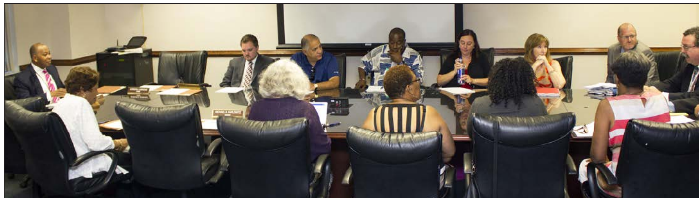
Dirigentes del capítulo Westchester de CSEA/VOICE se reúnen con el Comisionado de DSS Kevin McGuire, derecha, y miembros de la Legislatura del Condado Westchester para solucionar problemas de pagos.

Miembros de CSEA/VOICE están trabajando en muchos condados para hacer que el sistema de subsidios de DSS funcione mejor para las familias y los proveedores. Se han reducido los problemas de pagos en condados de todo el estado gracias al trabajo que realizan los equipos de DSS de CSEA/VOICE. Algunos de los muchos logros de nuestros miembros son: mejorar convenios de proveedores a nivel de condados; pagos más puntuales y exactos; ampliar la participación en las planillas de asistencia y horarios de cuidado infantil (CCTA); aumentar la dotación de personal para acelerar la determinación de elegibilidad de padres